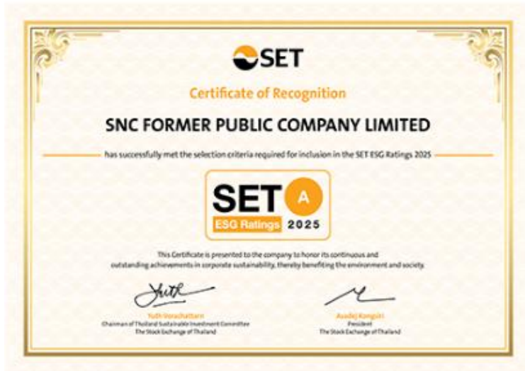
ESG Ratings 2025 ระดับ A